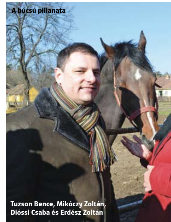
A búcsú pillanata

óriási a bizodalomunk. Mondhatnánk azt, ha csak Overdose képességeinek a 80 százalékát tudja, akkor már Opium Bullett is európai szintű versenyló lesz. De ezt majd az elkövetkező hónapok eredményei bizonyítják vagy nem.