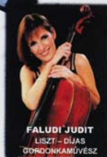
FALUDI JUDIT LISTZ - DÍJAS GORDONKAMŰVÉSZ