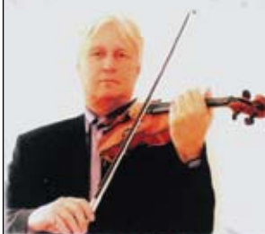
SZENTHELYI MIKLÓS KOSSUTH - DÍJAS HEGEDŰMŰVÉSZ