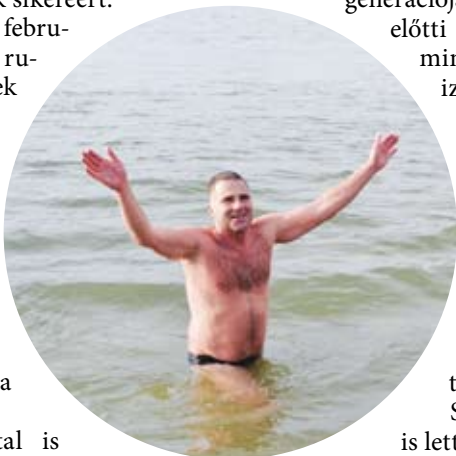
A Duna vize 1 °C volt

MÁSODKÖZLÉS: MEGJELENT A DUNAKANYAR RÉGIÓ 2014. 3. LAPSZÁMÁBAN