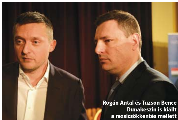
Rogán Antal és Tuzson Bence Dunakeszin is kiállt a rezsicsökkentés mellett

„A tavaszi országgyűlési választás tétje az, hogy folytatódnak-e a rezsicsökkentés politikája, a családok, munkavállalók, idősek támogatása. Vagyis, tovább tudunk-e haladni a megkezdett úton” – mondta köszöntő beszédében Tuzson Bence a választókerület fideszes országgyűlési képviselőjelöltje. Majd hozzátette: „Mindenkire szükség van ahhoz, hogy végleg le tudjunk számolni a múlt elhibázott politikájával, Gyurcsány Ferenc örökségével, és meg tudjuk védeni az elmúlt 4 évben elért eredményeinket. Ezért kérek mindenkit, hogy csatlakozzon a Magyar Csapathoz, a cselekvő magyarok közösségéhez, amely összefog és megvédi Magyarországot eredményeit.”- hangsúlyozta Tuzson Bence országgyűlési képviselőjelölt.