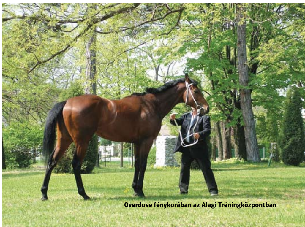
Overdose fénykorában az Alagi Tréningközpontban

FOTÓ: KESZI PRESS ÉS JUSZEL BÉLA MÁSODKÖZLÉS: MEGJELENT A DUNAKANYAR RÉGIÓ 2014. 3. LAPSZÁMÁBAN