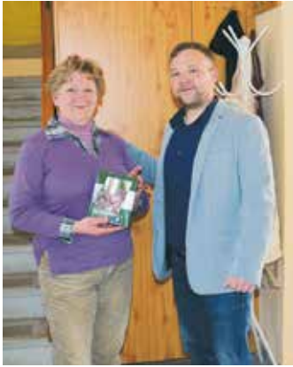
A Nőnapon a város több intézményében köszöntöttem a hölgyeket

A körzet – sőt talán nem túlzás, hogy az egész város – legnagyobb folyamatban lévő infrastrukturális fejlesztése az alagi nagyalomás környékén épülő P+R-parkoló létesítése, valamint az ehhez kapcsolódó út- és járdaépítések. A tavaly augusztus közepén megkezdett munkálatok hamarosan befejeződnek, a műszaki átadásra március 23. és 27. között kerül sor. Az állomásépület két oldalán 155 db gépkocsi tárolására alkalmas P+R-parkoló, valamint 42 db kerékpár elhelyezésére alkalmas B+R fedett kerékpártárolót vehetnek hamarosan birtokba a lakosok. A parkolók megépítése kapcsán a buszforduló új helyre került. Akárcsak az alsói és a gyártelepi vasútállomásnál, itt is új közvilágítási hálózat és térfigyelő kamera-rendszer létesül.