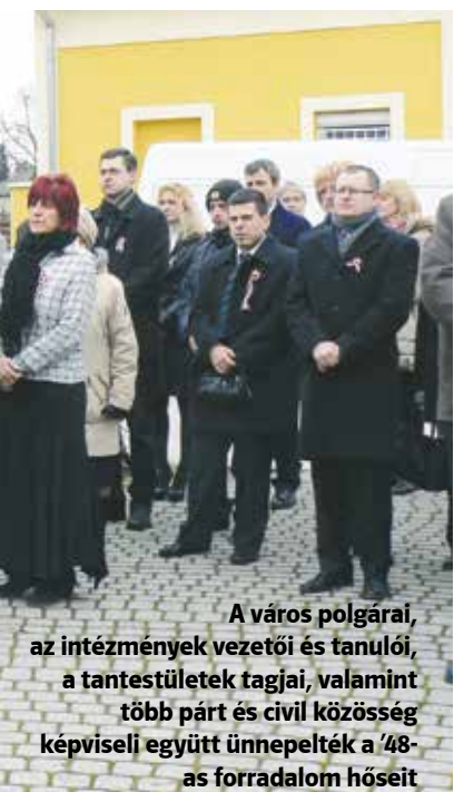
A város polgárai, az intézmények vezetői és tanulói, a tantestületek tagjai, valamint több párt és civil közösség képviseli együtt ünnepelték a '48-as forradalom hőseit