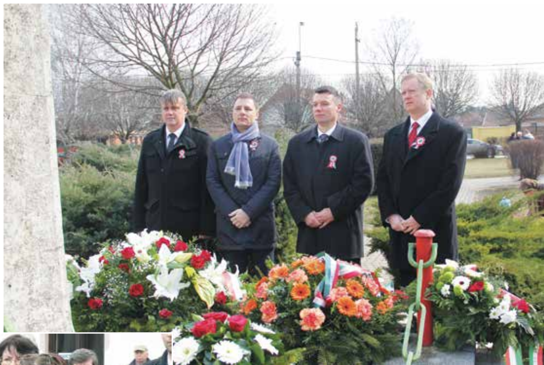
Dr. Molnár György, Tuzson Bence, Dióssi Csaba, Erdész Zoltán