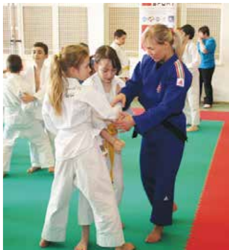
Az olimpiai bronzérmes és a jövő reményesei