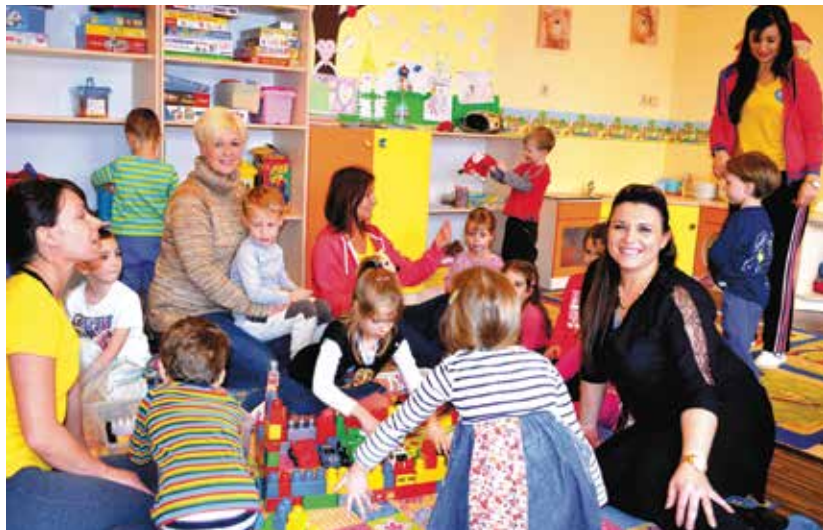
A felnőttek mellett ovisaink kedves meglepetéssel készülnek a jótékonyági rendezvényre

Támogatói jegyek vásárlására lehetőség van a KincsemSziget Óvodában reggel 8.00 órától délután 16.00 óráig, illetve az alábbi bankszámlaszámra lehet küldeni támogatásokat: 11701004-20061777 Vakok Batthyány László Római Katolikus Gyermekotthona