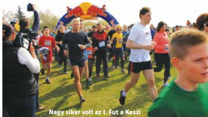
Nagy siker volt az I. Fut a Keszi