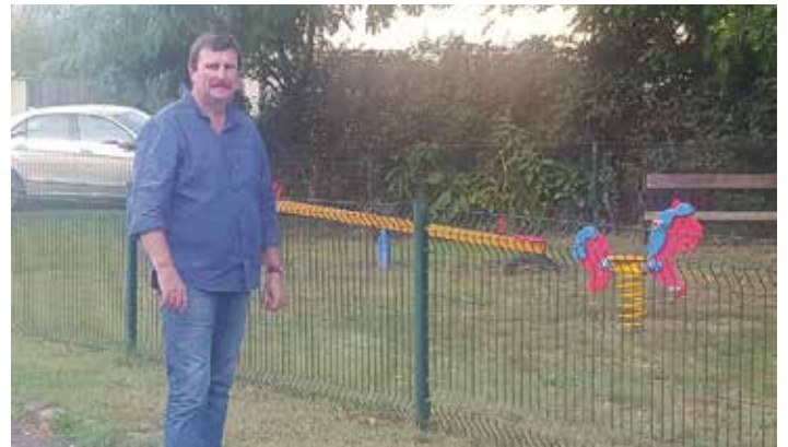
Kijavítottuk a Bajnok Géza téri játszótér kerítését, melyet egy autós szétört

Augusztusban sajnálatos módon a Bajnok Géza téri játszótér kerítésébe belerohant