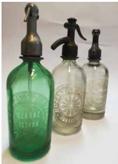
Dunakeszi szódásüvegek (Rozsnyai, Gózon, Száraz)

M egjelenése a 18. század végéig vezet minket vissza, amikor az angol Joseph Black (1772) és a svéd Torbern Bergman egy időben rájött arra, hogyan lehetne a vizet szén-dioxiddal úgy vegyíteni, hogy élvezetes italhoz jussanak. Az új termék üzemi méretű gyártását a genfi Jacob Schweppe kezdte meg, Angliában, és ő illetve 1798-ban először a soda (szóda) névvel.