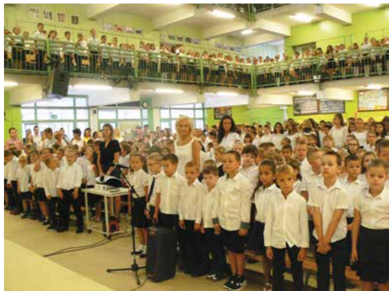
A Fazekasban 884 tanuló kezdte el az új tanévet

Végezetül „megnyugtatta” a diákokat, hogy a tanév nem csupán a tanulásról szól majd. Lesz színházlátogatás, ének, tánc, sport, és kirándulás.