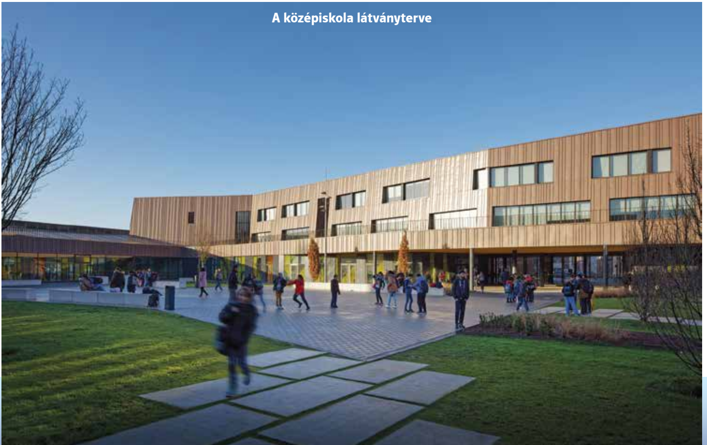
A középiskola látványterve

Óriási lehetőség és fontos lépések előtt áll városunk. Többéves előkészítés után letettük az alapkövet annak a beruházásnak, amely Dunakeszi történetében talán az eddigi legnagyobb ilyen jellegű fejlesztés. A nyár folyamán Magyarország Kor-