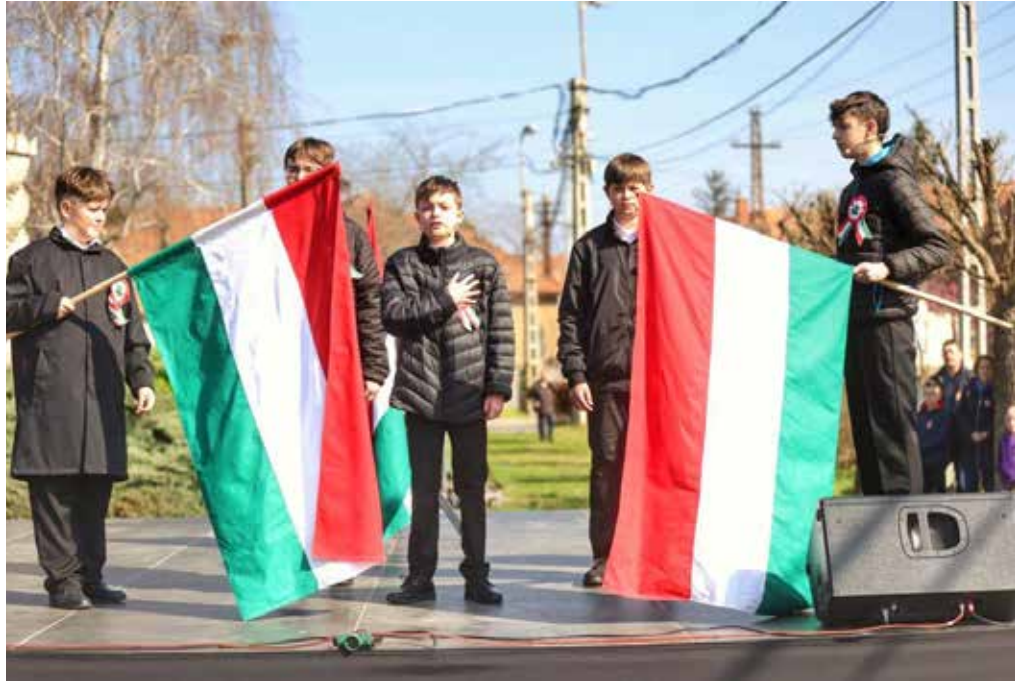
A Bárdos iskola színjátszó csoport tagjai