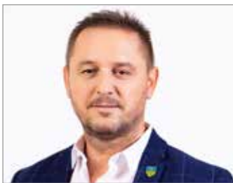
Tisztelt Választókerületek, kedves Dunakesziek!