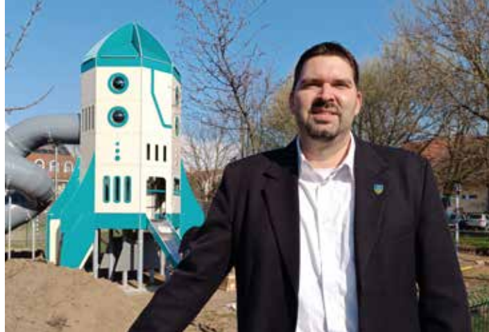
Nyíri Márton alpolgármester

ÁPRILIS 13-ÁN ÚJRA DUNAKESZI ÖNKÉNTES KÖZTISZTASÁGI NAP. ENNEK ÜRÜGYÉN BESZÉLGETTÜNK NYÍRI MÁRTON ALPOLGÁRMESTERREL, AKI IMMÁR TÖBB MINT TÍZ ÉVE SZERVEZI A VÁROS LEGNAGYOBB KÖZÖSSÉGI KÖRNYEZETVÉDELMI AKCIÓJÁT. TERMÉSZETESEN SZÓBA KERÜLT AZÉRT MÁS IS.