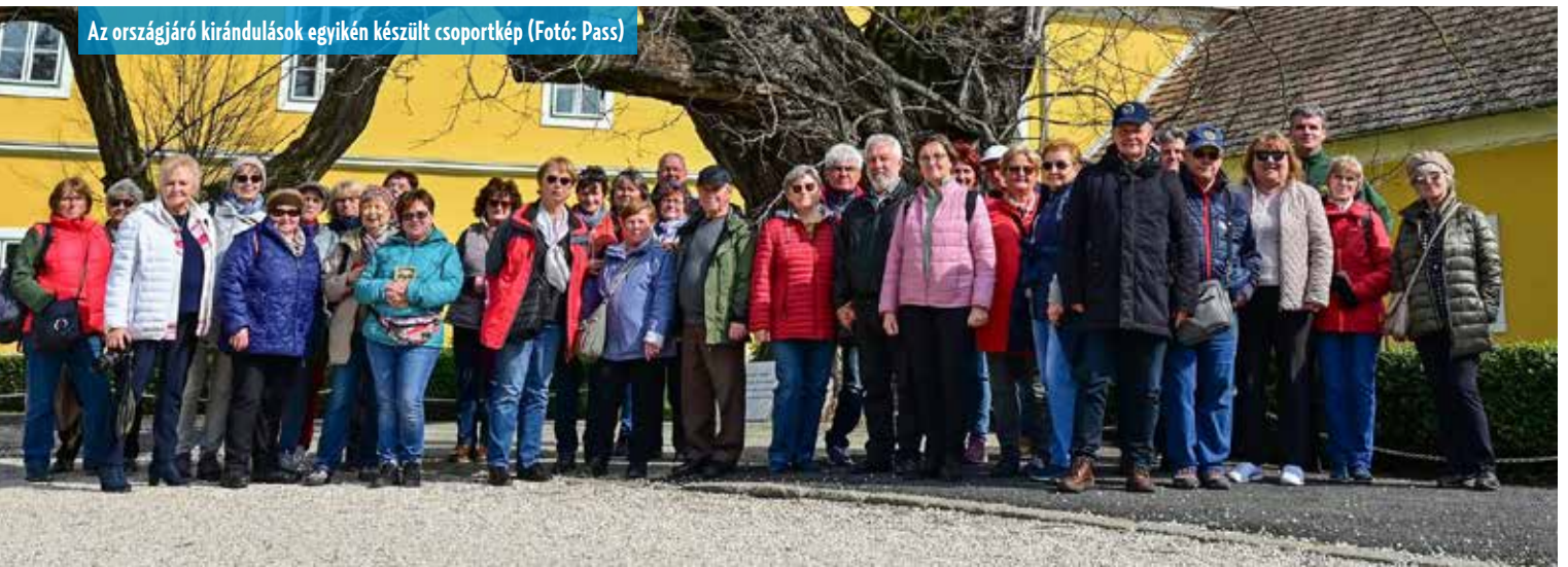
Az országjáró kirándulások egyikén készült csoportkép

„Vizsgáltuk az elégedettséget, igen jó visszajelzéseket kaptunk az eddigi lépéseinkről, de dolgozunk azon, hogy még elégedettebbek legyenek idős polgáraink. Például a Duna-parton a Dunasor felújítása során kétszer annyi padot tettünk ki, az Aradi vértanúk terénél és a Keszi farsornál az új sétányon is több pad lett elhelyezve, ugyancsak a jár-