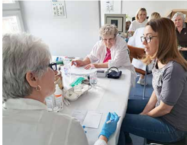
A fiatal korosztály képviselői is fontosnak tartják a rendszeres szűrővizsgálatokat