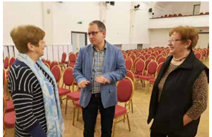
Az időügyi tanácsnok rendszeresen konzultál a nyugdíjas klub tagjaival

komolyan kellett venni. Leültünk beszélni az SZTK szakmai vezetésével, és kidolgoztunk egy módszert. Szerencsére erre a kezdeményezésre nagyon nyitottak voltak és biztosítottak két évvel ezelőtt egy, csak az idősök számára fenntartott napot, ahol tizenegynéhány szakszűrősen vehettek részt. Éppen a mai napon van az ideinek a regisztrációja, úgy hallom, már izznak a vonalak a városházán, annyian jelentkeznek, hála Istennek.”