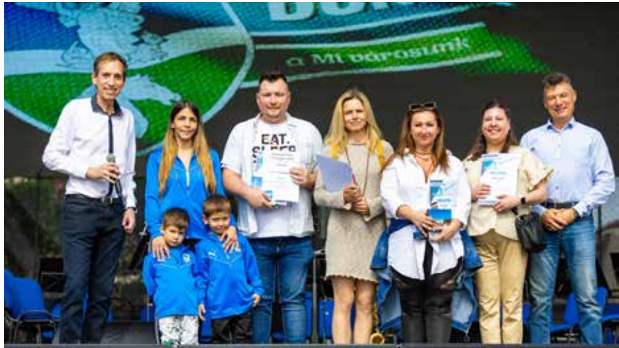
Nagy siker volt a Dunakeszi Post fotópályázata

Óriási siker volt a Majka-koncert Dunakeszi várossá válásának 47. születésnapján először hangzott el a