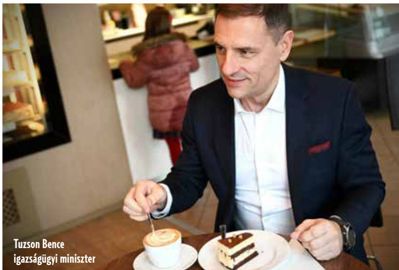
Tuzson Bence igazságügyi miniszter

DUNAKESZIN A NAPOKBAN KEZDŐDÖTT MEG A RÁKÓCZI ÚTNAK A SZENT IMRE TÉR ÉS A HUNYADI UTCA KÖZÉ ESŐ SZAKASZÁN AZ ÚTFELÚJÍTÁS, SZAKASZOS LEZÁRÁSOKKAL – FOGALMAZOTT A LAPUNKNAK ADOTT INTERJÚBAN TUZSON BENCE, VÁROSUNK ÉS TÉRSÉGÜNK ORSZÁGGYŰLÉSI KÉPVISELŐJE, HAZÁNK IGAZSÁGÜGYI MINISZTERE. A FAZEKAS MIHÁLY ÁLTALÁNOS ISKOLÁNÁL PEDIG AZ UTOLSÓ SIMÍTÁSOK ZAJLANAK AZ ÚJ KERÉKPÁRTÁROLÓKNÁL, A MUNKA TEHÁT FOLYAMATOSAN HALAD NEMCSAK VÁROSSZERTÉ, DE TÉRSÉGÜNK EGÉSZÉBEN IS – TETTE HOZZÁ. MINT MONDTA, A GAZDASÁGBAN AZT LÁTJUK, HOGY A ZÖLDENERGIA KORSZAKA MÁR NEM KOPOGTAT AZ AJTÓN, HANEM BERÚGTA AZT, VÉGÉRVÉNYESEN ÉS VISSZAVONHATATLANUL MEGÉRKEZETT: IMMÁR CSAK NÉHÁNY ÉV KÉRDÉSE, ÉS AZ ÉLETÜNK MINDEN SZEGLETÉBEN, SZEMÉLYES ÉLETTERÜNKBN IS MINDENHOL OTT LESZNEK AZ ENERGIATÁROLÓ ESZKÖZÖK.