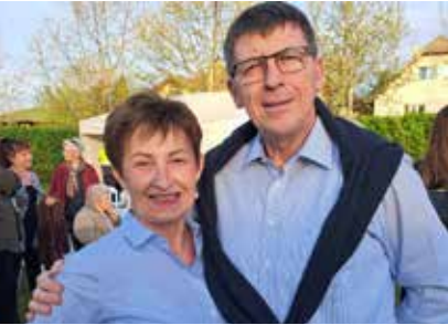
A Legindi házaspár

KUNDLYA ZSÓFIA LAKOSSÁGI KAPCSOLATOKÉRT FELELŐS ÖNKORMÁNYZATI MEGBÍZOTT EGY IGAZÁN EREDETI ÉS NAGYSZERŰ ÖTLETE ALAPJÁN DUNAKESZIN VÁROSSÁ VÁLÁSÁNAK 47. SZÜLETÉSNAPJA ALKALMÁBÓL ÁPRILIS 6-ÁN LÁT-VÁNYOS ÜNNEPSÉG KERETÉBEN KÖSZÖNTÖTTÉK AZOKAT, AKIK DUNAKESZIN LÁTTÁK MEG A NAPVILÁGOT.