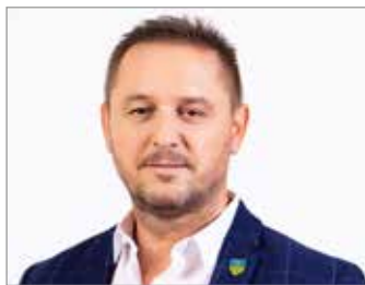
Tisztelt Választókerületiek, kedves Dunakesziek!