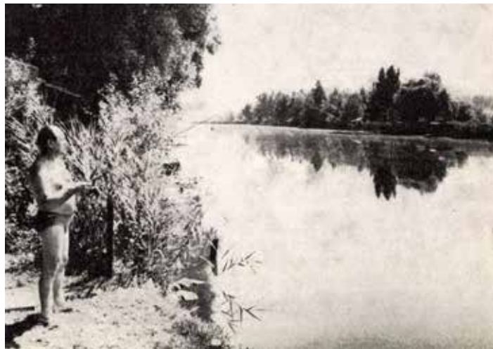
A Tőzegtavak 1984-ben

Valaha, úgy 18-20.000 évvel ezelőtt a mai Székesdülő egy dunai sziget volt, amelynek napjaink ipari parkja és a Dunakeszi-Alsó közötti része előbb holtággá, majd nádassá, végül láppá vált. A dunakeszi Tőzegtavak tehát utolsó hírmondói annak, hogy egykor ezen a területen is folyt a Duna. Ma két kis tóról van szó , amelyek között időszakos összekötő csatornák biztosítanak kapcsolatot.