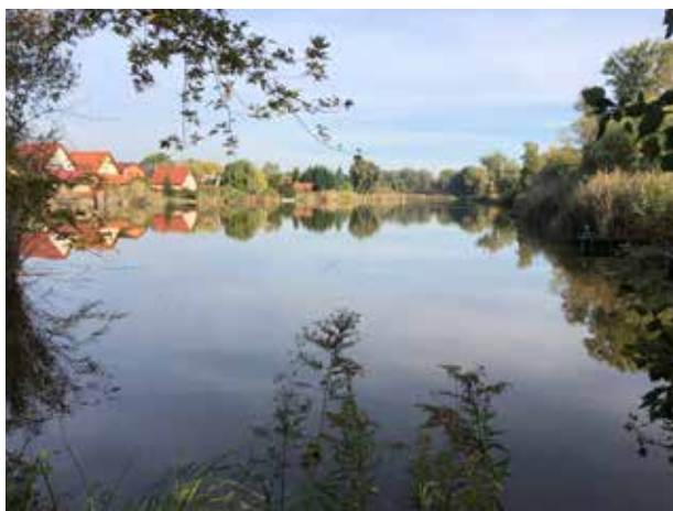
A Tőzegtavak 2019-ben

A MOCSARAS TERÜLET EGYKORON A MOGYORÓDI-PATAKTÓL DUNAKESZIIG HÚZÓDOTT. Ahogy a Duna visszahúzódott, a tó mentén vizes élőhely jött létre. Később a tó is visszahúzódott, így a part menti erdős, cserjés részek elpusztultak, a talajba kerültek, ahol oxigénhiányos állapot alakult ki: tőzeg alakult ki. Utóbbi 1959 és 1965 között – az Egyesült Dunamenti Mgtysz. mellékküzemágaként – kitermelték, a gödröket részben a talajvíz, részben a tudatos elárasztás révén tavakká alakították.