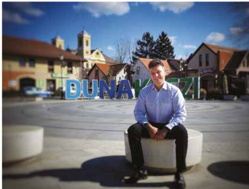
Diósi Csaba polgármester

- Egyértelműen a rendszeresség a célunk, hogy folyamatosan legyen elérhető programlehetőség a célközönségünknek. Jönnek a jobbnál jobb ötletek a lelkes fiataloktól, így rengeteg tervünk van, van miből válogatni. Nem szeretnénk egyelőre leléni a poént, de az elkövetkezendő hónapokban sok programmal készülünk, kihasználva a jó időt is! Egy párat említve a teljesség igénye nélkül: focikupa, KESZI-KLUB PIKNIK, sörpong-bajnokság, gardróbvásár, ... stb. Mindent azért nem adunk ki egyből, ezért is érdemes figyelemmel követni az oldalainkat!