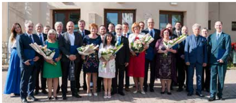
A városi kitüntetettek a polgármesterrel és a képviselő-testület tagjaival