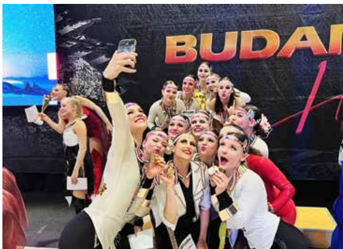
A győztes formáció boldog tagjai

A ROCK'N ROLL VILÁGSZÖVETSÉG ÉGISZE ALATT A MAGYAR TÁNCSPORT SZAKSZÖVETSÉG TÁRSRENDEZÉSÉBEN A SOROKSÁRI SPORTCSARNOK ADOTT OTTHONT AZ AKROBATIKUS ROCK'N ROLL SPORTÁG 2024. ÉVI ELSŐ VILÁGVERSENYÉNEK!