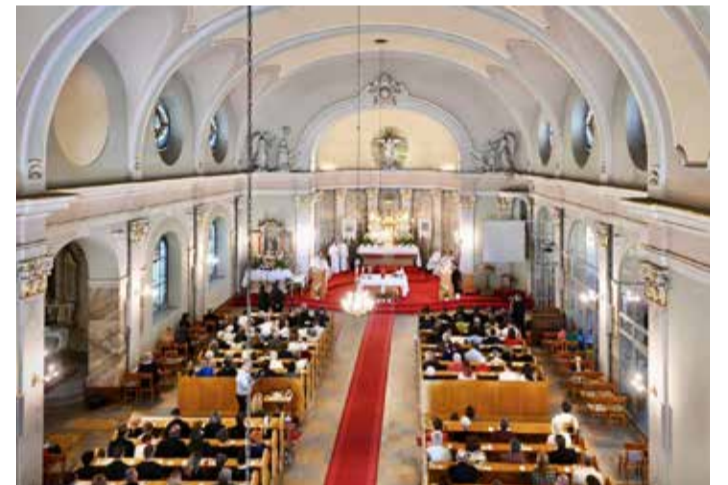
A dunakeszi Szent Mihály-templom

A felújítás I. ütemében (2022. januártól 2022. júniusig) készült el az utcai épület teljes tetőcsereje, részleges energetikai felújítása, továbbá az épületen belüli bontási munka. A II. ütemben megtörtént a teljes