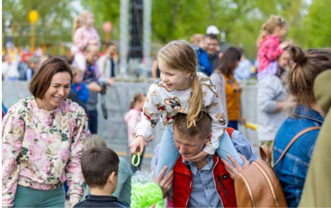
Kicsiket és nagyokat egyaránt tartalmazó programok várták a város születésnapján

1977. április 1-jén kapott városi rangot Dunakeszi Nagyközség, amely az elmúlt közel fél évszázad alatt Pest vármegye egyik legjelentősebb településévé formálódott a folyamatos és tudatos városépítő tevékenységnek köszönhetően. A várossá válás 47. születésnapját április 6-án látványos családi nap keretében ünnepelte Dunakeszi apraja, nagya. A születésnap nem csupán egy évforduló, hanem egy emlékeztető arra az izgalmas és változatos utazásra, amelyet a ma már közel ötvenezres város az elmúlt évtizedek során megtehetett.