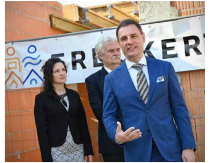
Tuzson Bence igazságügyi miniszter, országgyűlési képviselő

Kérdésünkre válaszolva a képviselő beszélt arról is, hogy az ötezer fő feletti településeken CSOK Plusz néven új, kamattámogatott hitelkonstrukciókat vezetnek be: „Ugyanakkor megemeltük az ebben a konstrukcióban elérhető összegeket is. Az így megkapható hitelösszeg a gyermekszám függvényében tizenöt-, harminc-, illetve ötvenmillió forint lehet. Ezzel is kiszámíthatóságot nyújtunk a családoknak, mert ha ez az érzés megvan a fiatal házásokban, akkor van nagyobb esélye annak, hogy gyermeket vállaljanak. Mi 2010-ben úgy döntöttünk, hogy a családokat helyezzük a középpontba, és mindent a családok szolgálatába állítunk. Ennek szellemében áprilistól elstartolt a kétszázmilliárd forintos keretösszegű, a harminc év alatti fiatalok elhelyezkedését, munkába állását segítő Ifjúsági Garancia Plusz program is. Ennek részeként bizonyos esetekben száznolcvanezer forintig albrélti támogatás is igényelhető, de a programban fontos szerepet kap a bértámogatás és az útiköltség-hozzájárulás is. Egyebek mellett például ez azt is jelen-