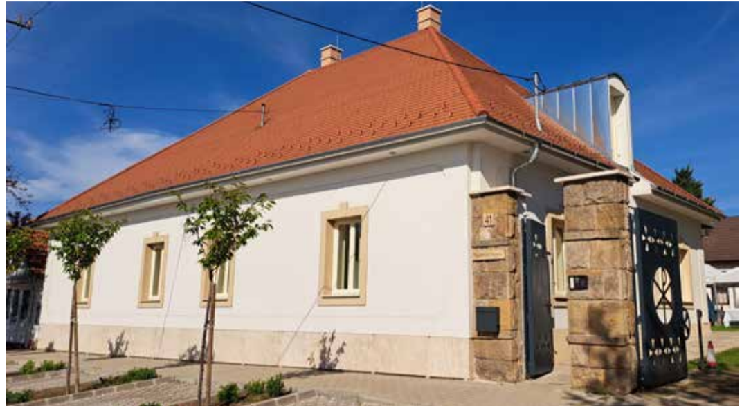
A XVIII. században épített plébánia megújulva fogadja a közösségeket