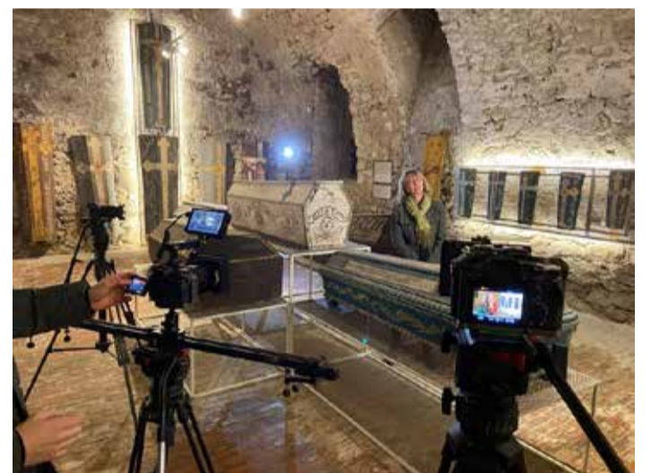
A váci múmiákról készülő dokumentumfilmben a szakemberek szólnak meg