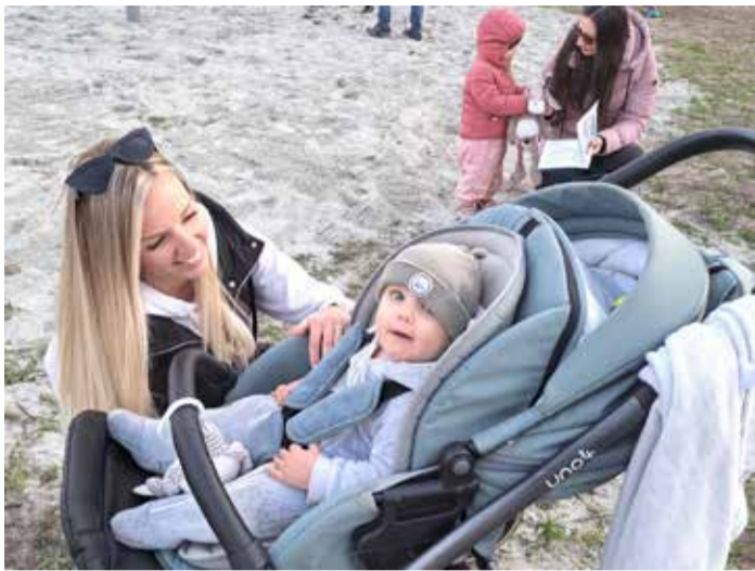
A legkisebbek is jól érzik magukat a D. Ordass Lajos játszótéren

A kisgyermekes szülők minden bizonnyal egyetértenek azzal a megállapítással, hogy – sok mással együtt – Dunakeszin a tavasz a város 24 játszótére közül kilencnek a felújításáról, az új játszóeszközök telepítéséről szól, hiszen ki ne tudná, hogy megújult a D Ordass Lajos parki játszótér, amely új mászó várat is kapott, rugós mérleghinta, trambulín és csúszda is készült a kislányok és a fiúk nagy örömeire.