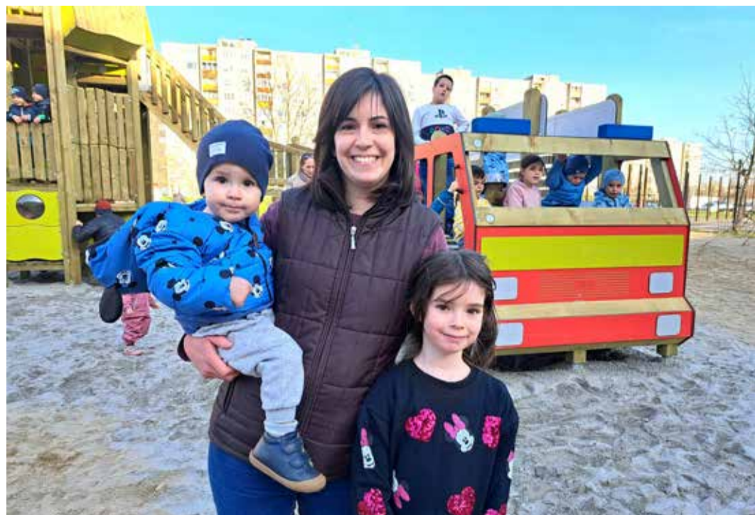
A Szent István parkban épített tűzoltóautós játszótér valóssággal vonzza a gyerekeket

– Nem túlzás, ha azt mondom, napi kapcsolatban vagyok az itt élőkkel, hogy a felmerülő problémák megoldása érdekében közösen hozzuk meg a lehető leggyorsabb és a legopti-