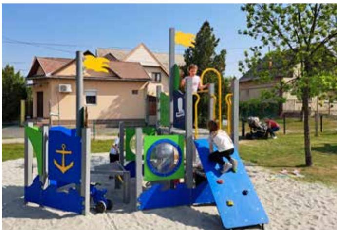
Közkívánatra kalózhajó épült a Szabadság téri játszótéren