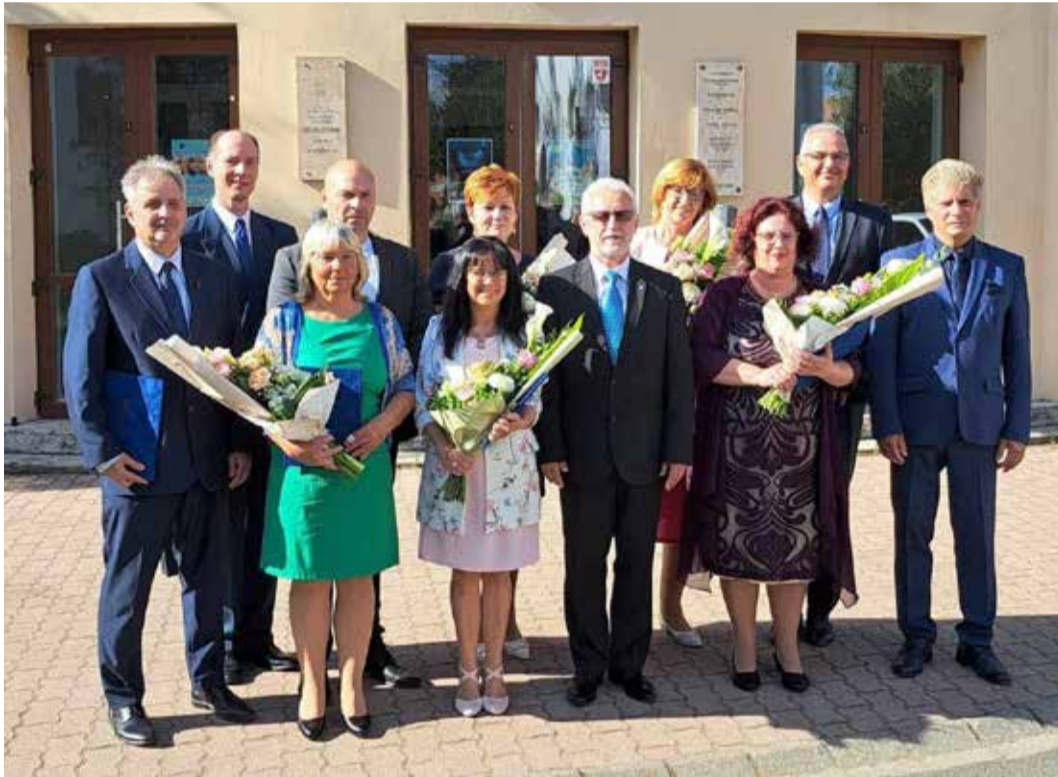
Dunakeszi ideai városi kitüntetettjei

Mivel a miénk hazánk legfiatalabb átlagéletkorú térségeinek egyike, és a miénk az ország legnagyobb tankerülete, településeinken folyamatosan szükség van újabb és újabb iskolai, óvodai és bölcsődei férőhelyekre, nem véletlen tehát, hogy az oktatás-nevelés áll fejlesztéseink középpontjában – fogalmazott a lapunknak adott nyilatkozatában Tuzson Bence, térségünk országgyűlési képviselője, hazánk igazságügyi minisztere. Példaként említette, hogy Csömörön februárban kezdte meg működését a tavaly novemberben átadott Hársfa bölcsőde, amelyet az egykori Laky-kúria épületében alakítottak ki. Főton az elmúlt időszakban felújítottuk a Népművészeti Szakgimnázium és Gimnáziumot, megépült a Waldorf óvoda új épülete, és bővítettük a Boglárka bölcsődét, hamarosan pedig újabb fejlesztések kezdődhetnek a helyi sporttelepen, ahol mobil öltözővel bővül a foci pálya – tette hozzá.