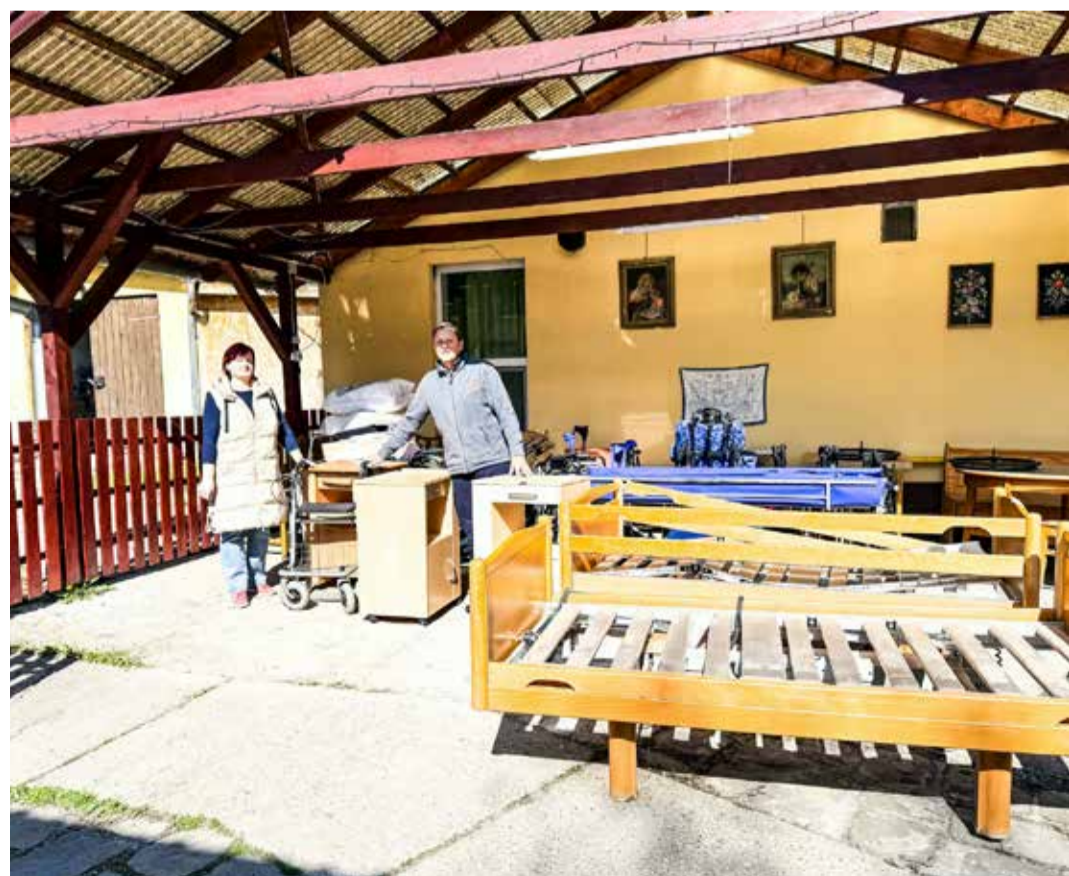
A németországi testvérvárosból érkezett adomány