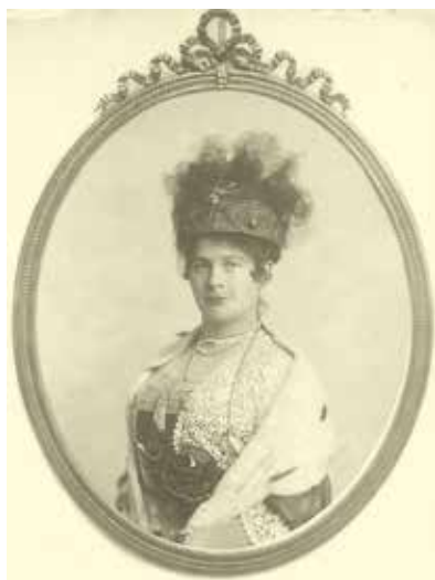
Augustza főhercegnő (, 1910 körül)

1915. augusztus 1-jén hatalmas népünnepélyre került sor Dunakeszi-Műhelytelepen. Budapestről és Vácról vonatokkal jöttek a vendégek, a dunakeszi és alagi lakosok gyalogosan rótták a mély homokot. Mindannyian az éppen épülő MÁV Dunakeszi Főműhelybe igyekeztek, amelynek munkásétkezőjében – a mai VOKE József Attila Művelődési Központ színháztermében – hatalmas hadikórház működött.