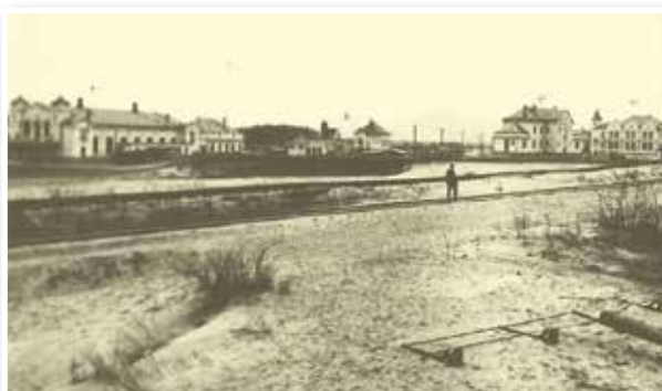
A telep látképe 1926 előtt, bal oldalon a mai VOKE József Attila Művelődési Központ épülete