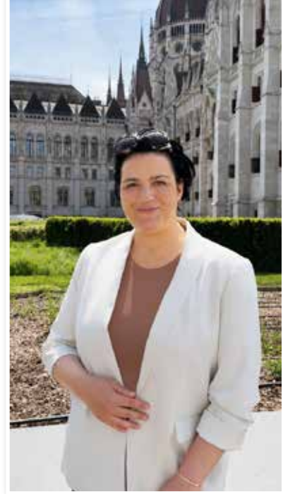
Dr. Miskolczi Orsolya, Dunakeszi országgyűlési képviselője az Országgyűlés két szakbizottságában tevékenykedik