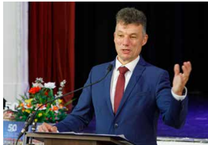
Dióssi Csaba polgármester